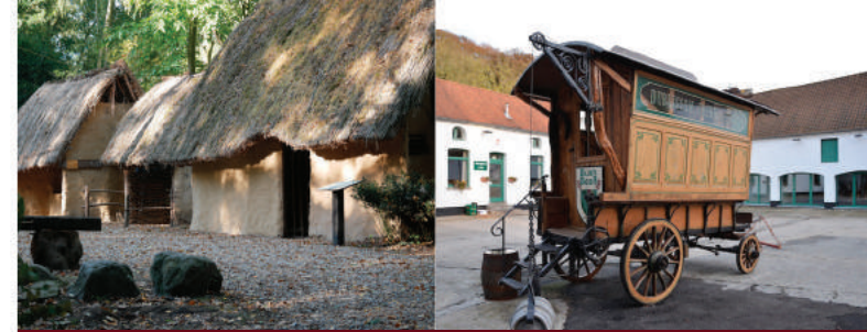
Archéosite® et Musée d'Aubechies-Belcæil asbl

Aubechies vers : Ath +/- 13 km Belcæil +/- 6 km Pipaix +/- 15 km